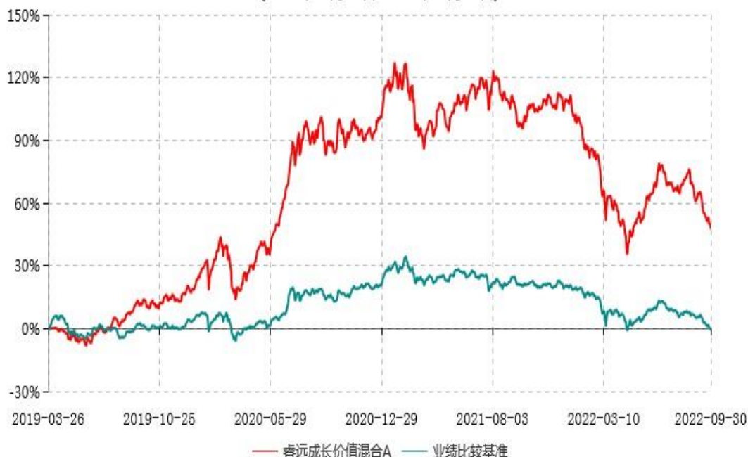
睿远成长价值混合A累计净值增长率与业绩比较基准收益率历史走势对比图 (2019年03月26日-2022年09月30日)