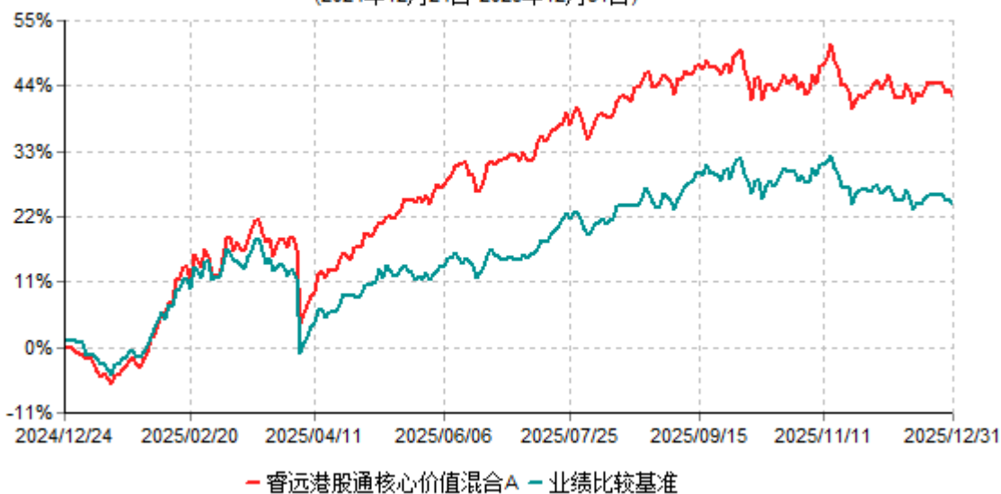
睿远港股通核心价值混合A累计净值增长率与业绩比较基准收益率历史走势对比图 (2024年12月24日-2025年12月31日)