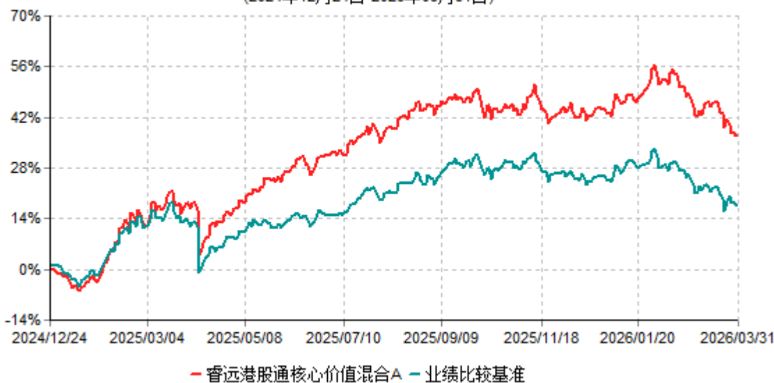
睿远港股通核心价值混合A累计净值增长率与业绩比较基准收益率历史走势对比图 (2024年12月24日-2026年03月31日)